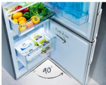
Ouverture à 90° sans débord

Grâce à l'ouverture de porte sans débord, il est désormais possible d'installer le réfrigérateur directement contre un mur. Il est également possible d'utiliser l'ensemble des tiroirs en toute simplicité.