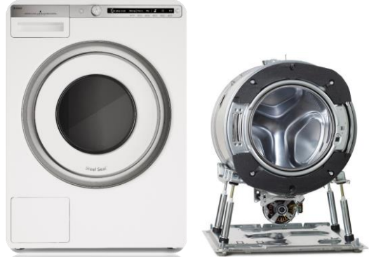
Système Quattro™ = Cuve qui repose sur quatre amortisseurs pour maintenir la stabilité