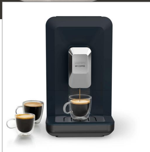
My Coffee, Machine à café automatique, Café fraîchement moulu My Coffee, Machine à café automatique, Café fraîchement moulu EA2004E0

Entièrement automatique et compacte pour des boissons savoureuses.