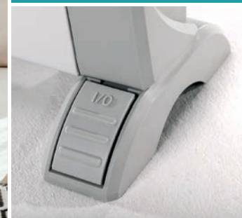
Interrupteur marche/arrêt au pied : l'astuce pratique pour ne pas avoir à se baisser