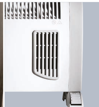
Fonction Turbo "Grille de diffusion de chaleur"