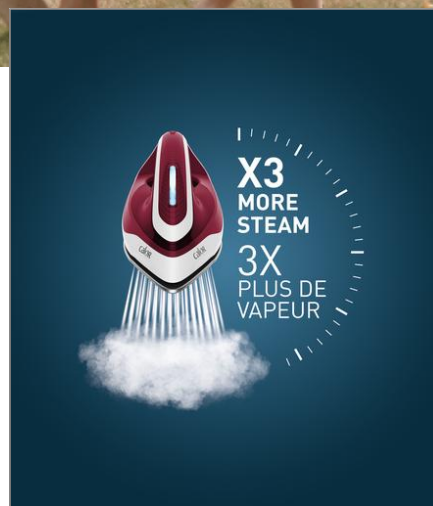
EXPRESS EASY 5.7 BARS BOURGOGNE OPAQUE CENTRALE VAPEUR SV6130C0

Réduit votre temps de repassage de 30 %*